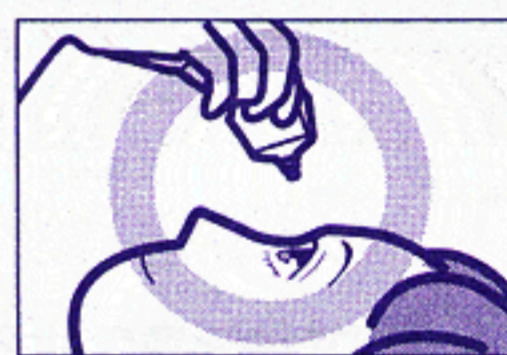
容器の先を下に向けて点眼