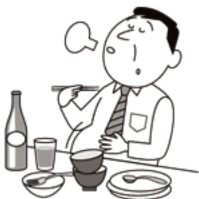
●過度な飲食や肥満

過度な飲食や肥満、喫煙習慣、急激な温度変化や夜ふかしは、心臓に負担をかけ、どろきや息切れの原因となります。