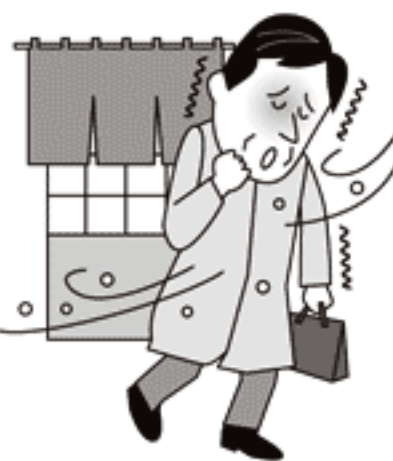
●急激な温度変化や夜ふかし