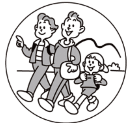
旅行など環境の変化で おなかの調子をくずしたときに