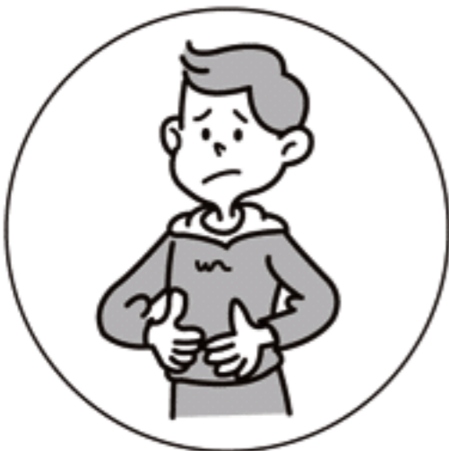
おなかの弱い方の 整腸に