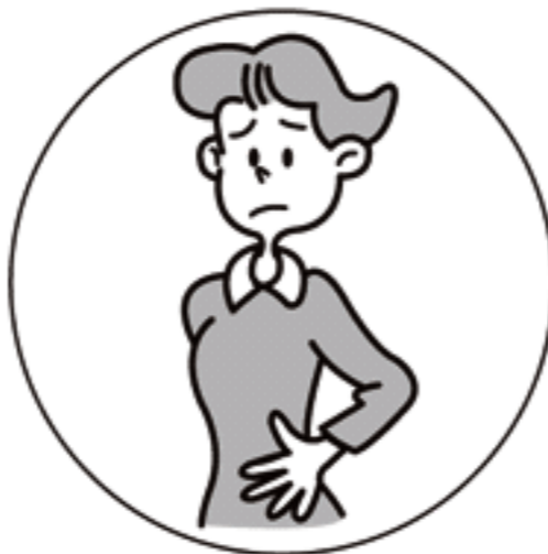
おなかが はったときに